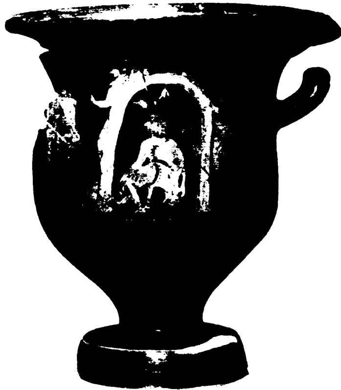
FIGURA 3. Crátera acompañada con figuras rojas, del museo de Siracusa (36319); C. V. A., Italia (Museo Archeologico di Siracusa), XVII, fasc. I, IV, 8; A. D. Trendall, The Red-figured Vases of Lucania, Campania and Sicily , Oxford, 1967, Campanian, I, n° 32, pág. 204.

blancas marcan las asperezas de la roca. 133 Su pie izquierdo enfermo se apoya sobre aquélla. Sostiene en su mano derecha una pluma, sin duda destinada a aliviar sus sufrimientos, y en su mano izquierda su arco. Por encima de él unos pájaros, producto de su última caza; insisto: de su última caza porque su carcaj, suspendido a su izquierda, está vacío . Bajo su brazo izquierdo un ánfora está hundida en el suelo. Los dos personajes que emergen por encima de la gruta no plantean ningún problema. A la izquierda, Atenea, con casco y escudo redondo de hoplita, se halla encima de una roca. A la derecha, Ulises, reconocible por su pilos (gorro de marino) y por su barba, tiene su carcaj cerrado (¿con las flechas de Filoctetes?). A la izquierda, apoyado en un árbol, hay un efebo desnudo, la clámide bordada hacia atrás, mientras su tahalí suelto parece formar cuerpo en el árbol; puede corresponder o a Diomedes, que acompañaba a Ulises en la pieza de Eurípides, o bien al Neoptólemo de Sófocles. 134 Es éste un problema relativamente secundario porque es