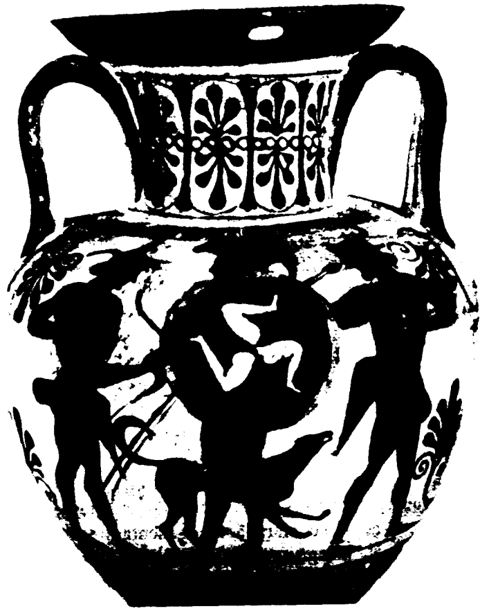
FIGURA 1. El hoplita, oculto en parte por su escudo (adornado con una triscele) y acompañado por su perro, sale de caza, flanqueado por dos arqueros escitas. Ánfora con figuras negras (finales del siglo VI), Musée du Louvre , F (260) C.V.A., Louvre, fasc. 5, Francia, fasc. 8, 111 He. 54, 4; M. F. Vos, Scythian Archers , número 166.