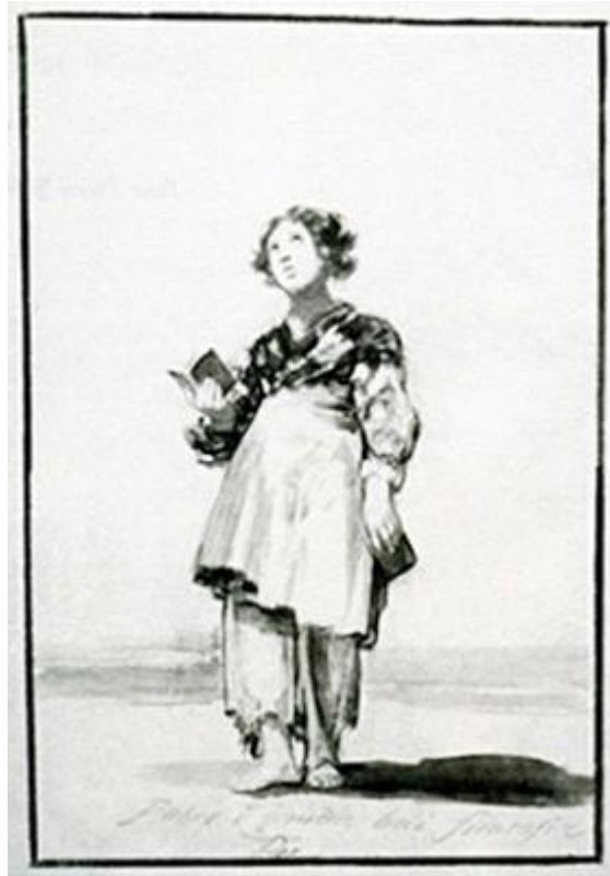
Figura 1. Pobre y desnuda va la filosofía.

Fuera de España sólo empieza a ser conocido a partir de mediados del siglo XIX, décadas después de su muerte.