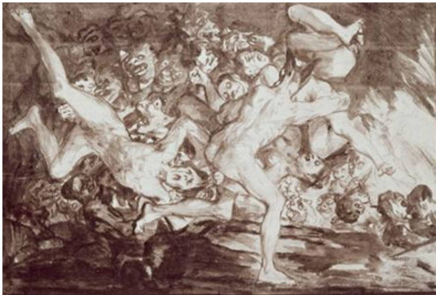
Figura 37. Camino del infierno.

Es como si Goya enlazara con el proyecto de los Sueños, anterior a los Caprichos . Además afloran aquí reminiscencias de los cartones para tapices, de los Caprichos , de los Desastres de la guerra y de los dibujos. Toda la serie ilustra la ruptura con la representación del mundo visible, que Goya sustituye por la de los habitantes de su mundo interior. El espacio está más radicalmente desestructurado que nunca, y no hay puntos de referencia. ¿Por qué no se limitó a los dibujos, con los que había empezado, sino que decidió pasar al grabado? El grabado facilita reproducir y difundir imágenes, pero estas imágenes especialmente enigmáticas nunca saldrán de su estudio. Quizá también en este caso contaba con los espectadores y aficionados del futuro, que estarían en condiciones de entenderlos totalmente.