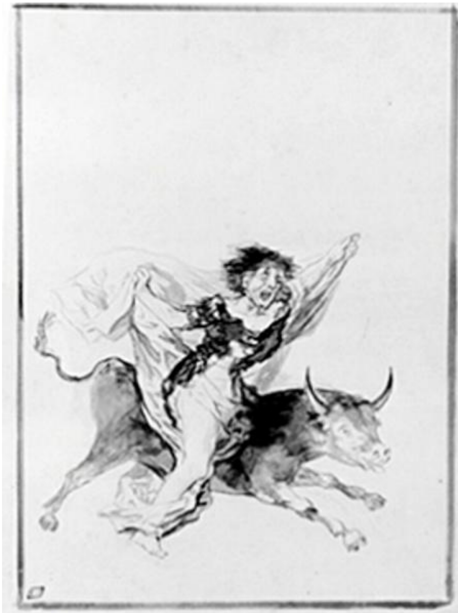
Figura 29. Pesadilla.

tema. Así, se mantiene el interés de Goya por los temas de brujería. Dos viejos brujos (D 4, GW 1370, Figura 28) bailan flotando en un espacio indeterminado. Uno de ellos toca las castañuelas, y el otro se agarra al primero. Sus rostros expresan una especie de alegría. Además, el dibujo se titula Regozijo . El vuelo, alejarse del suelo y a la vez de las leyes que rigen el espacio humano parecen materializarse en el mundo de los brujos, como sucede con los fantasmas sexuales del pintor.