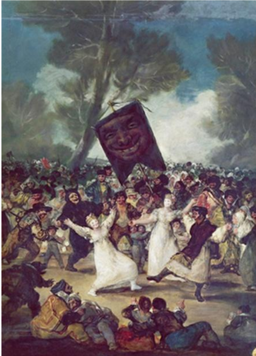
Ilustración 18. El entierro de la sardina, 1814-1816, Madrid, Academia San Fernando, GW 970 (detalle).

desempeñarán las poses de los locos el mismo papel que las máscaras, que esconden y muestran a la vez?