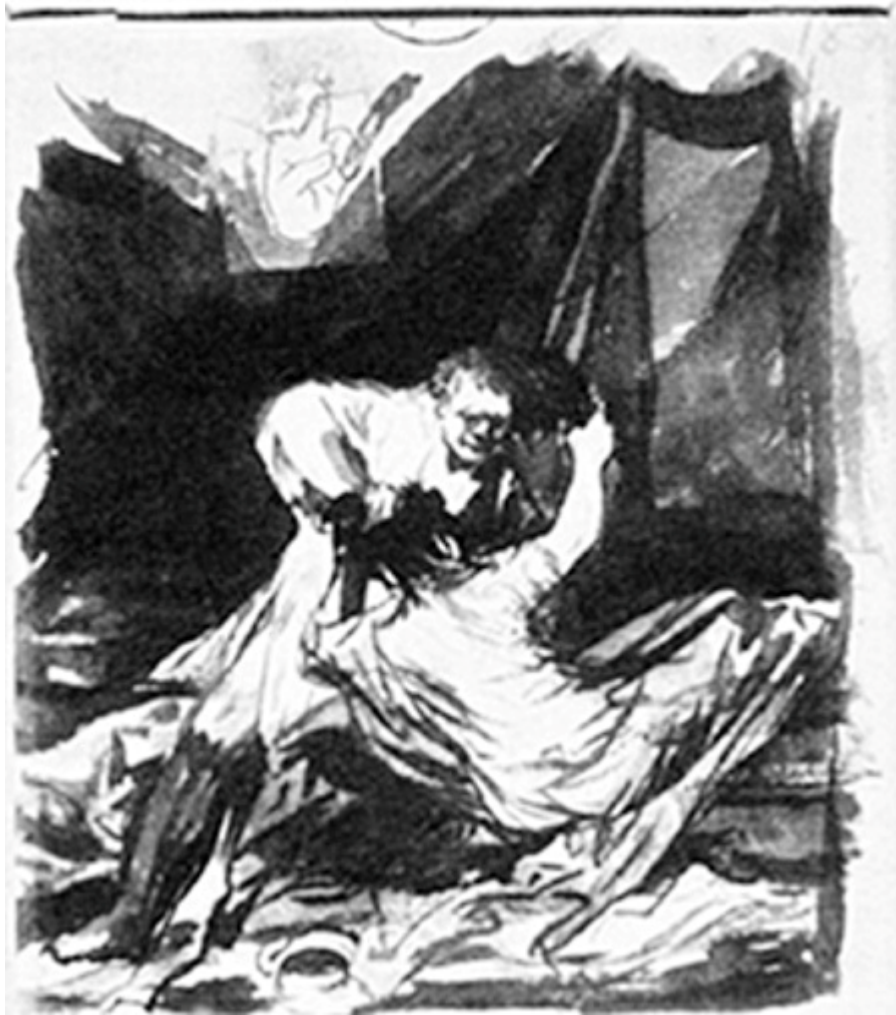
Figura 34. Lucha conyugal.

caras, cuatro brazos, cuatro piernas e incluso ocho pies, que se dirige a un grupo de espectadores, parecido a las criaturas que pueblan las paredes de la Quinta del Sordo. Este ser doble no parece precisamente feliz.