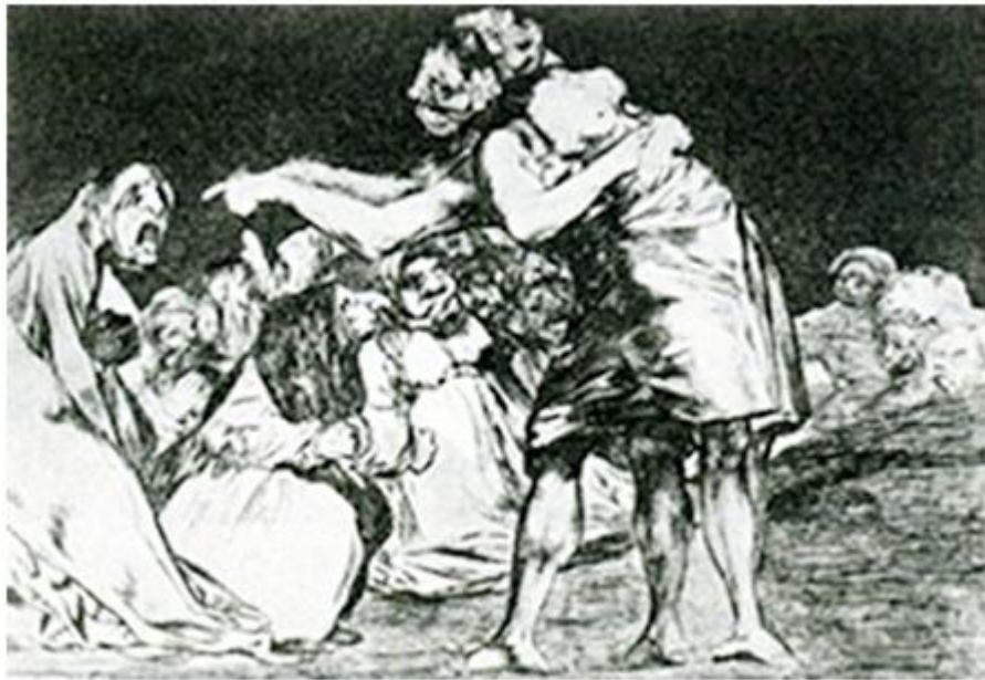
Figura 33. «Disparate desordenado», Disparate 7 .