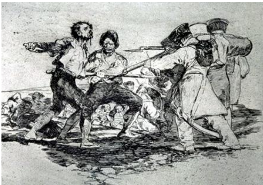
Figura 12. «Con razón o sin ella», Desastre 2 .

una precisión fotográfica, sino para testificar que los actos que representa son reales, y estos dos grabados no muestran las escenas más impactantes. Circula otra insistente leyenda sobre los Desastres , que difícilmente puede defenderse si observamos las imágenes en conjunto. Pretende que estos grabados son la expresión del espíritu patriótico de Goya, que muestran a los españoles como víctimas inocentes y héroes valerosos, mientras que los franceses son bárbaros verdugos. Evidentemente, no todos comparten esta opinión. Lafuente Ferrari escribe: «Los que no se resignan a ser víctimas se convierten también ellos en verdugos en cuanto pueden, resistentes cuyas reacciones empujan a las peores crueldades (...) El valor excepcional de los Desastres consiste precisamente en que esta serie de grabados no está al servicio del patriotismo». 27 Es verdad que las víctimas españolas son más numerosas (las armas de los franceses están más perfeccionadas), pero la violencia y el sinsentido aparecen equitativamente repartidos entre los dos bandos.