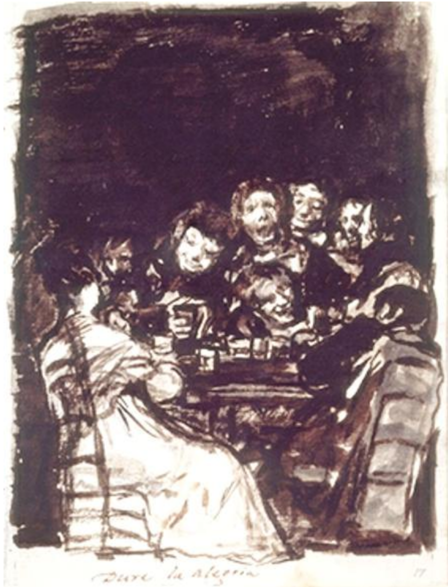
Figura 24. Dure la alegría.

interpretación de la figura. El hombre sentado a la derecha, lejos de su compañera, y tan negro como ella blanca, debe de designar otra abstracción.