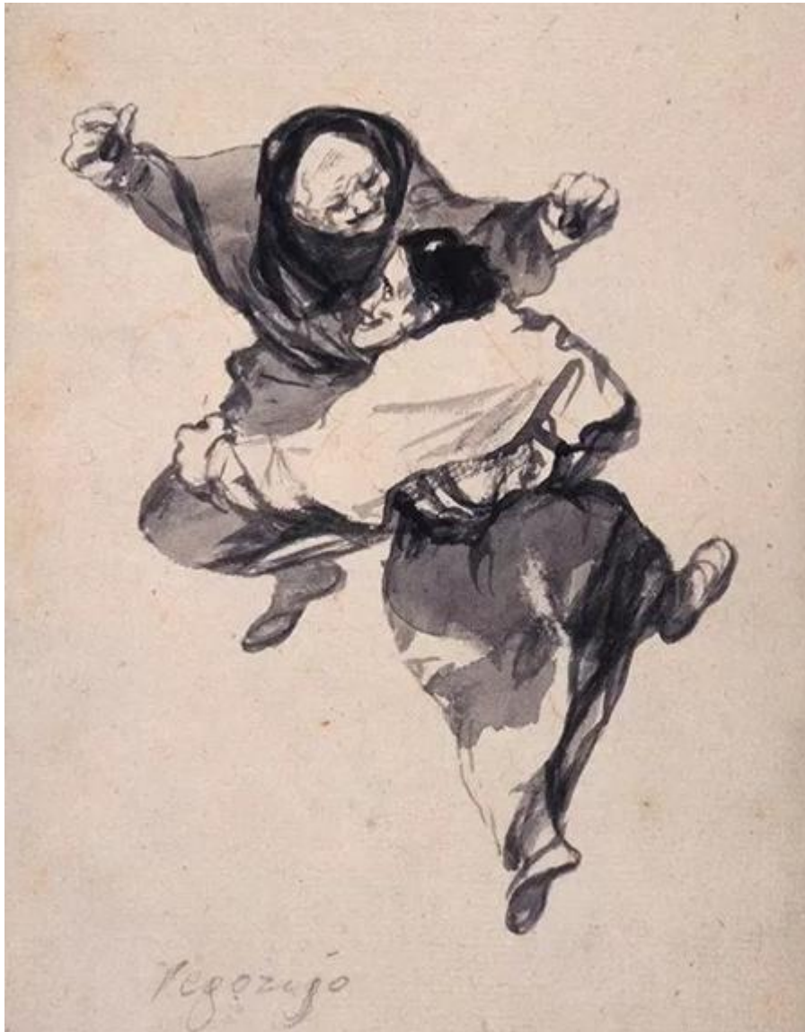
Figura 28. Regozijo.

El Goya que ha dibujado estas imágenes parece tranquilo y sereno. Vemos en el rostro de algunas mujeres víctimas de la violencia masculina, o de los poderes públicos, ese aire de pureza e inocencia que Yves Bonnefoy cree que sólo es posible «en la medida en que la persecución haya librado a la víctima de la fatalidad de ser verdugo». 37