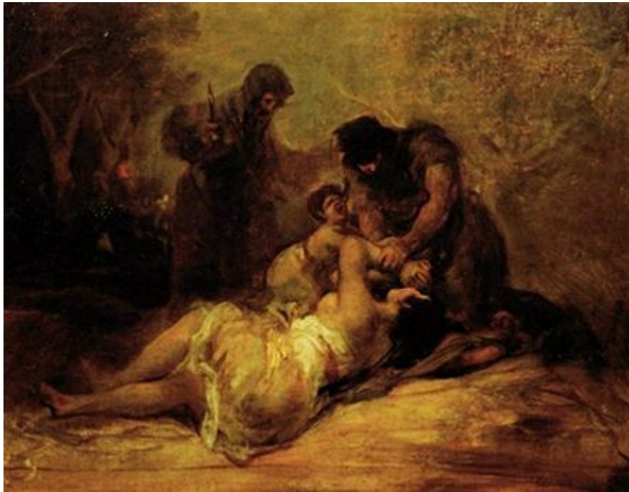
Ilustración 14. Escena de raptó y asesinato, 1800-1810, Frankfurt, Kunstinstitut, GW 930 (detalle).

Escena de guerra (GW 948), que forma parte de un conjunto de cuadros que pueden verse en Buenos Aires y del que algunos dudan que sea obra de Goya, es uno de los raros ejemplos de una imagen de batalla.