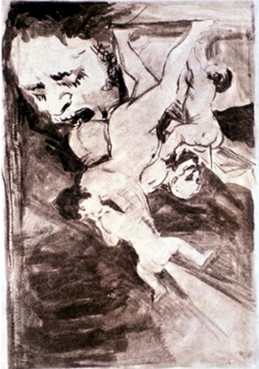
Figura 5. Proclamación de brujas.

Se los entregan en junio de 1798. El mundo de la brujería recupera aquí el modo de representación que habían inaugurado los cuadros de 1793.