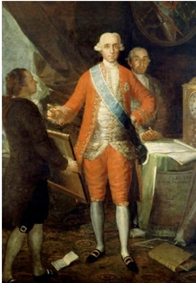
Ilustración 2. El conde de Floridablanca, 1783, Madrid, Banco de España, GW 203.

Está acompañado por un arquitecto, o un ingeniero, que le muestra los planos de construcción de un canal, como vemos en las láminas situadas junto al conde.