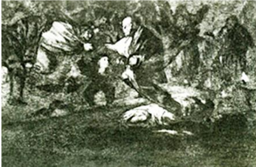
Figura 36. «Disparate fúnebre», Disparate 18.

grabados (GW 1600, Figura 36) era el que debía de encabezar la serie. Representa a un hombre mayor que se alza desde un cuerpo dormido. Como imagen inaugural, sería pues, una vez más, un retrato simbólico del autor, que, un poco como en la figura 6 y en otros dibujos, está presente en el mundo real (tumbado) y a la vez en el sueño (incorporado).