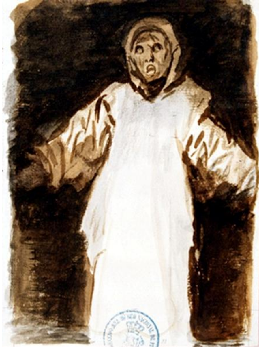
Figura 25. Que quiere este fantasma.

lleva un látigo con el que golpea a los pájaros negros que tiene delante. Con la mano izquierda sujeta una balanza.