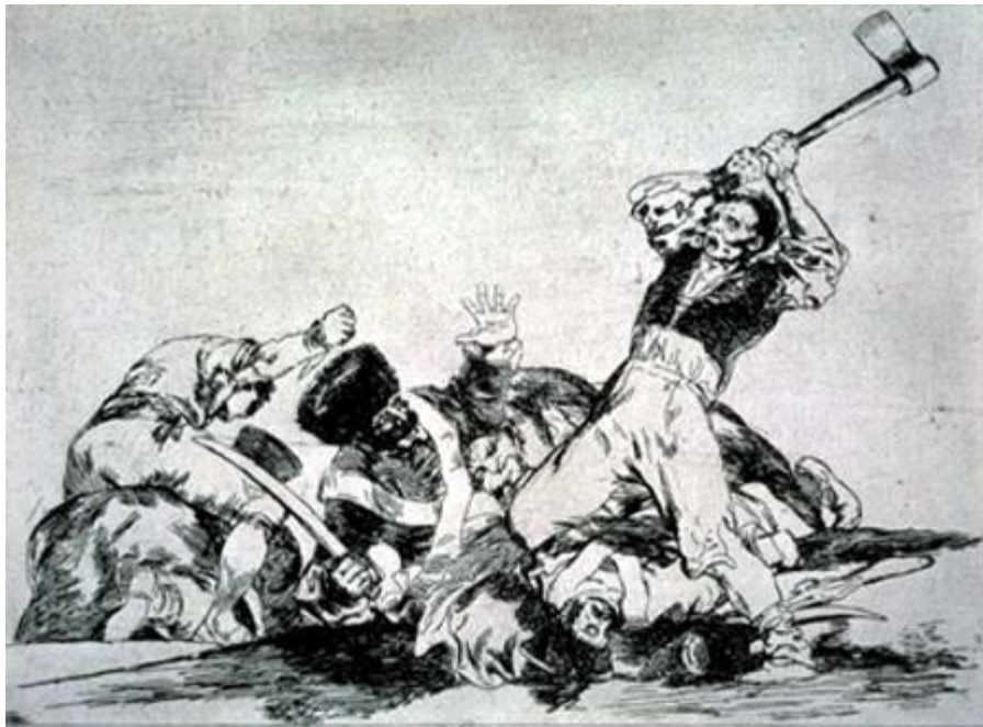
Figura 13. «Lo mismo», Desastre 3 .

Observemos cómo Goya demuestra esta tesis. Para que no nos confundamos, inserta al principio de la serie, inmediatamente después del grabado sobre los «presentimientos», dos grabados: el primero ( Desastre 2 , GW 995, Figura 12) muestra a soldados franceses ejecutando a insurgentes españoles, y el segundo ( Desastre 3 , GW 996, Figura 13), a combatientes españoles masacrando a franceses con hachas. Si todavía quedaban dudas sobre el sentido de esta yuxtaposición, quedarán disipadas al leer las leyendas, que ponen los puntos sobre las íes. La primera dice: «Con razón o sin ella», y la segunda se limita a decir: «Lo mismo». La primera masacre es «imperialista», y la segunda, «patriótica». Así, la serie de grabados establece de entrada la posible inversión de verdugos y víctimas. Recuerda también el papel marginal de las justificaciones que proporciona la razón, ya que la violencia es desencadenada por fuerzas que escapan a la razón.