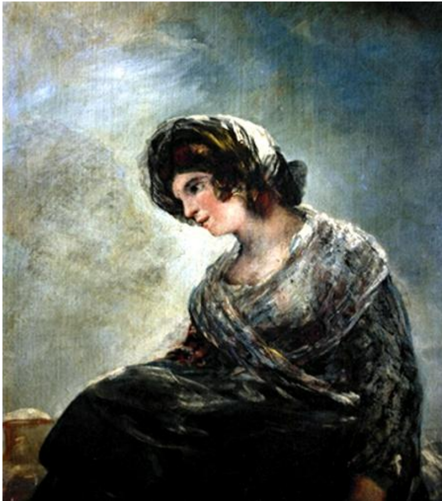
Ilustración 24. La lechera de Burdeos, 1826-1827, Madrid, Museo del Prado, GW 1667.

Pinturas negras: el mismo fondo indeterminado, formado por una mezcla de colores, y la misma actitud del personaje, que escucha en actitud pensativa. Sin embargo, vista de perfil, la mujer de La lechera es más joven. Resulta conmovedor pensar que este cuadro, quizá el último que Goya terminó, no representa a un demonio, no muestra la menor atracción por los abismos y no caricaturiza ninguna debilidad humana, sino que da testimonio de la benevolencia del pintor hacia su personaje, esa mujer hermosa y reservada a la vez.