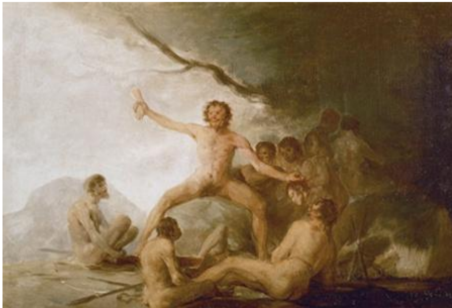
Ilustración 16 Escena de canibalismo, 1800-1810, Besançon, Musée des Beaux-Arts, GW 923.

piernas del hombre de este último cuadro recuerda también los gestos de las brujas (en el Capricho 65 , Figura 8). Como los demás gestos de esos caníbales exóticos, es fruto de la imaginación de Goya, más que de la observación. Estas escenas —de bandidos, de guerra y de canibalismo— nada tienen de anecdótico. Goya no pretende estigmatizar determinados comportamientos deplorables, ni de los «salvajes» ni de los «civilizados». Muestra en sus diferentes formas la violencia en sí, propia de todas las comunidades humanas y que espera las circunstancias adecuadas para abrirse camino.