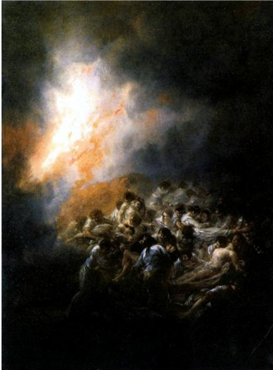
Ilustración 7. El incendio, 1793, colección particular (Madrid, Banco Inversión Agepassa), GW 329.

agudo sentido del movimiento y también con una precisión algo fría, pinta la impotencia de las víctimas.