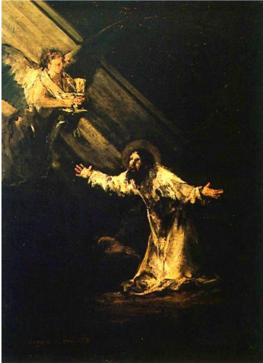
Ilustración 20. Jesús en el huerto de los olivos, 1819, Madrid, Escuelas Pías, GW 1640.

Más o menos en ese mismo momento pinta uno de sus últimos cuadros de tema religioso.