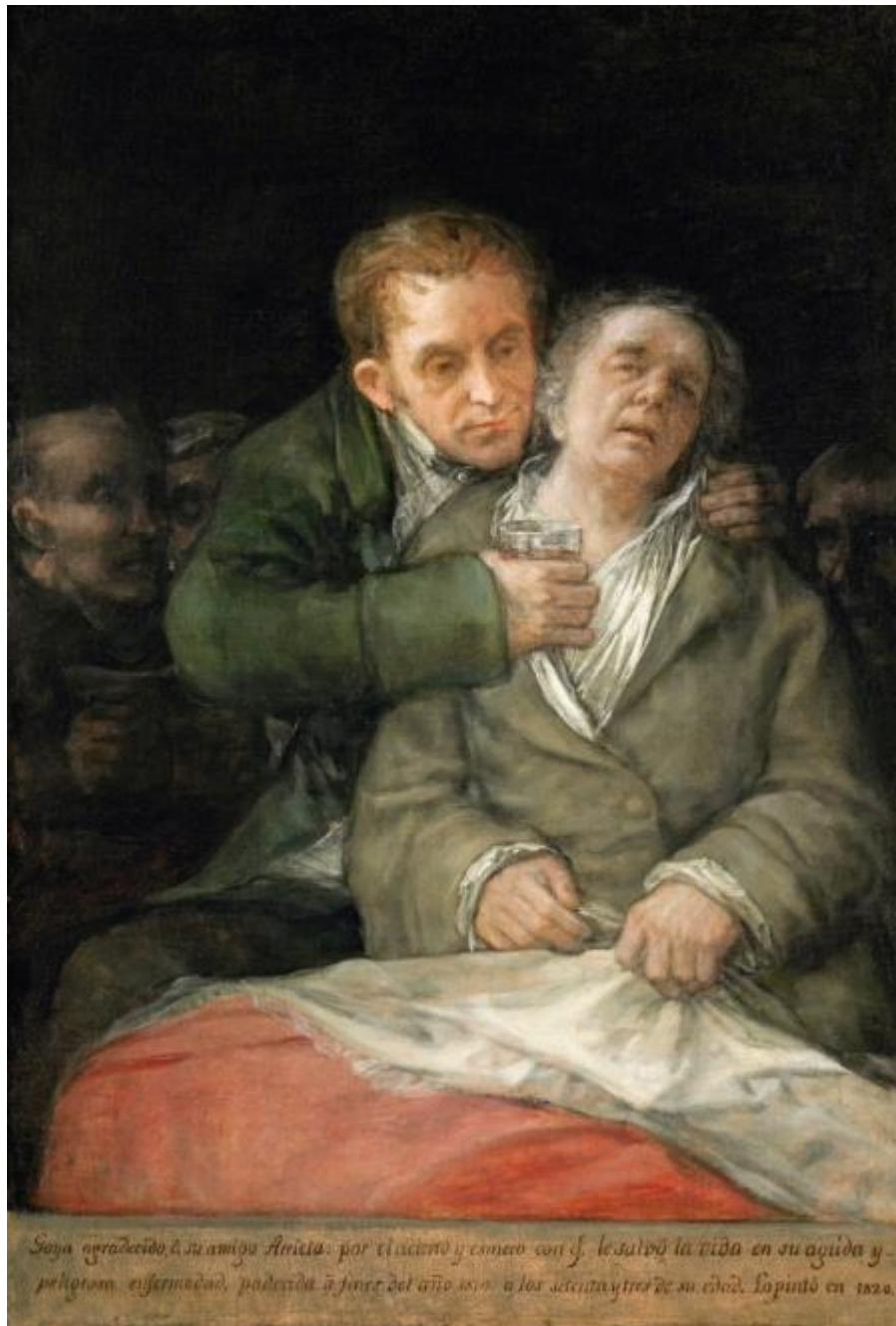
Ilustración 19. Autorretrato de Arrieta, 1820, Minneapolis, Fine Arts Museum, GW 1629.

El año anterior Goya había pintado un cuadro que mostraba los últimos momentos de la vida de otro personaje (GW 1638), pero la escena era