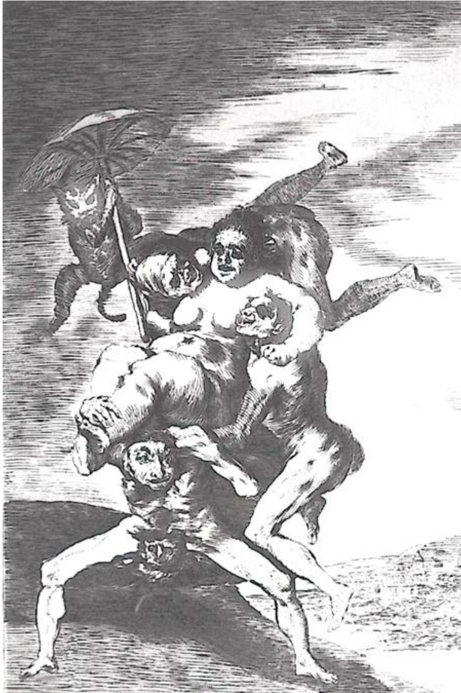
Figura 8. « ¿Dónde va mamá?», Capricho 65.

La intención satírica está presente a lo largo de toda la serie, pero no es éste su único sentido.