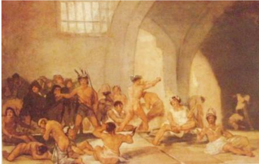
Ilustración 17. Casa de locos, 1814-1816, Madrid, Academia San Fernando, GW 968.

muestra de la fragilidad de la vida. El fútbol, deporte preferido de los europeos de hoy en día, posee un simbolismo más sublimado y menos rico.