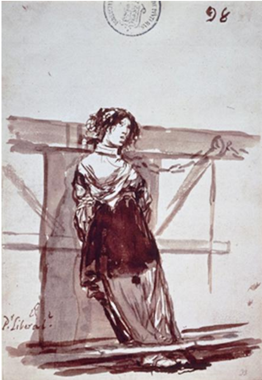
Figura 19. ¿Por liberal?

había constatado Erasmo unos trescientos años antes, apoyar un objetivo muy deseable permite olvidar que los medios empleados para alcanzarlo nos alejan de él cada día.