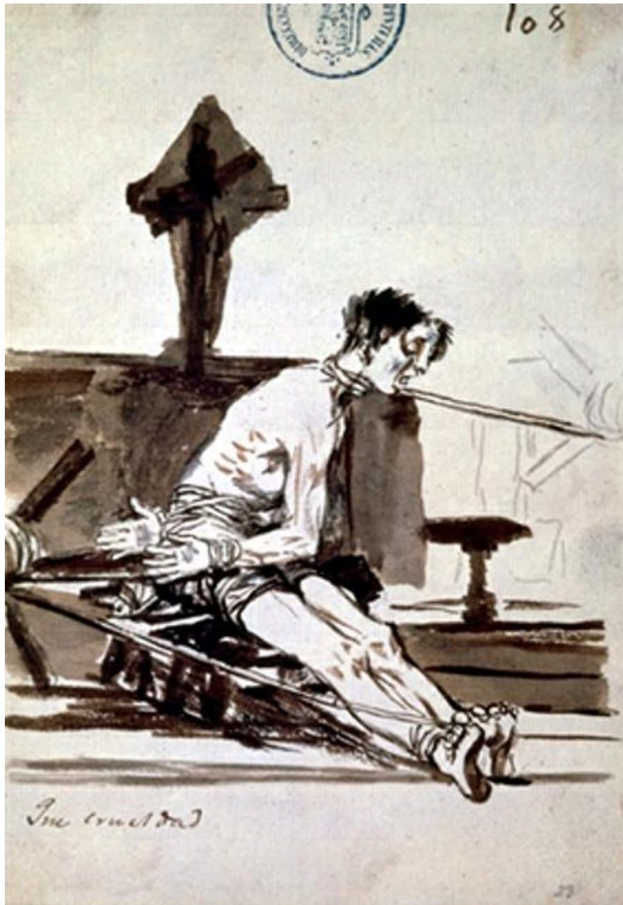
Figura 20. Que crueldad.

álbum (C 108, GW 1344, Figura 20) ilustra torturas dignas de Abú Graíb: una polea tira de cuerdas atadas a las manos y a los dedos de los pies del prisionero, que tiene alrededor del cuello otra cuerda atada a otra polea.