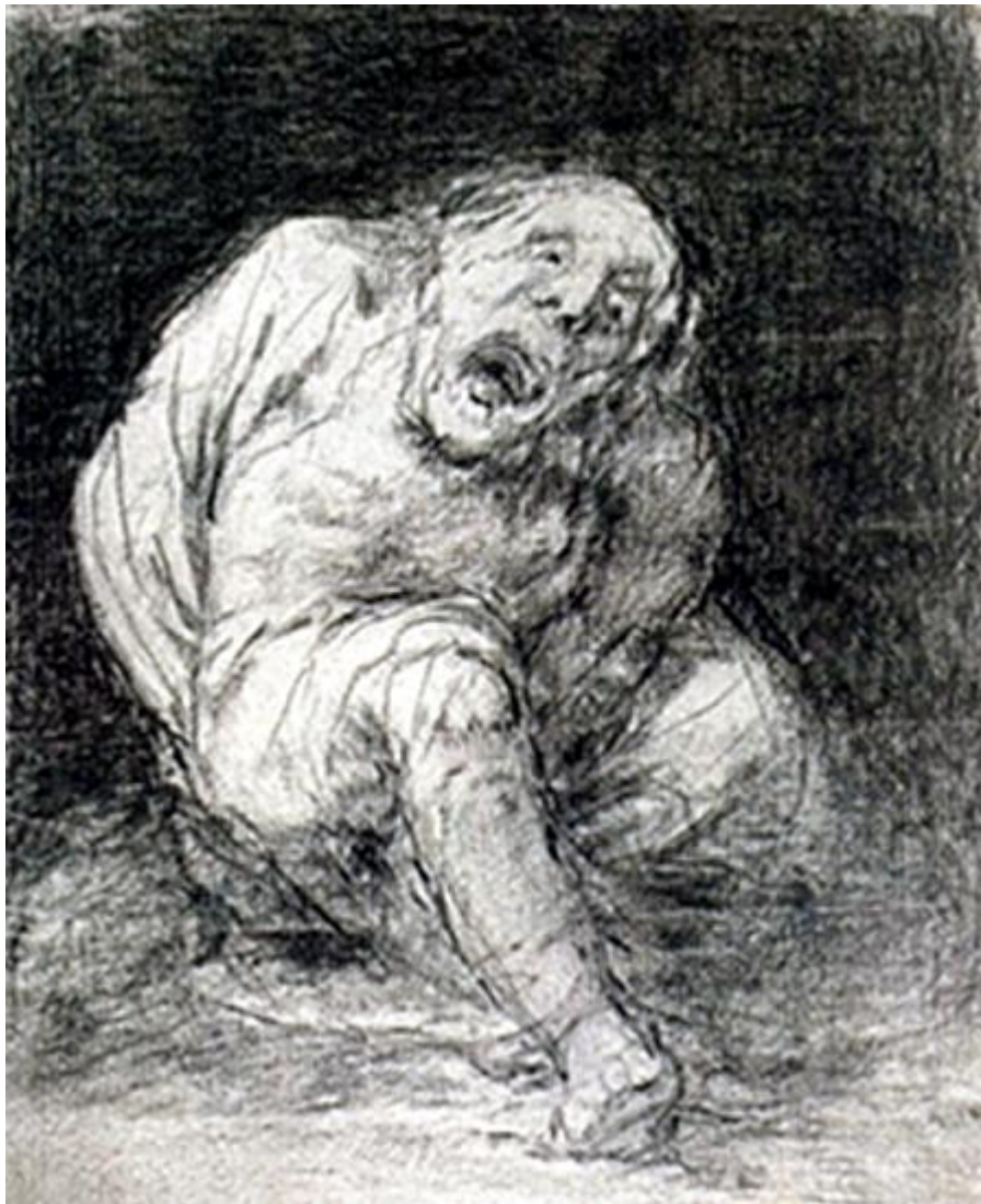
Figura 40. El idiota.

satisfacción (los locos no se parecen entre sí). Goya parece no juzgarlos. Se limita a mostrarlos. También ellos son nuestros hermanos. Un Loco furioso (G 33, GW 1738) está encerrado en una celda, ha pasado la cabeza, un brazo y una mano por los barrotes de la ventana y su mirada está perdida en la lejanía. Tiene la cabeza sujeta por grilletes, de modo que está doblemente encerrado.