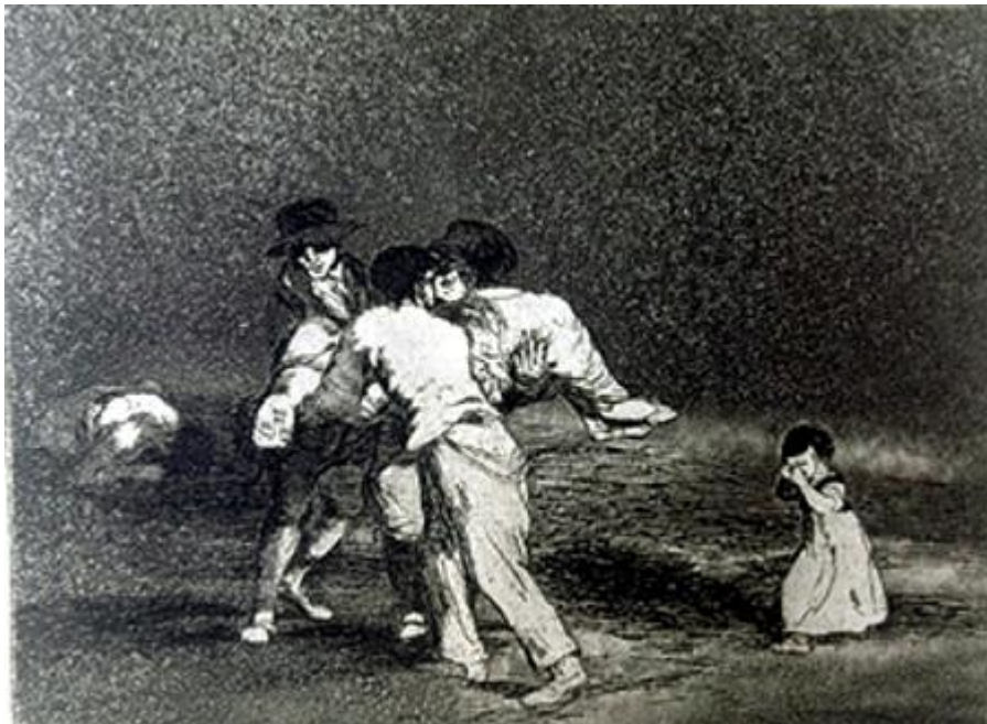
Figura 15. «Madre infeliz», Desastre 50 .

grabados más antiguos, coloca ante nosotros una pila de cuerpos muertos, que contemplan dos testigos, seres humanos normales y por lo tanto desesperados, uno de los cuales podría ser el pintor, observador abrumado. El olor pestilente de los cuerpos en descomposición invade la imagen. Desastre 60 (GW 1094), grabado que remite al periodo del hambre, es bastante parecido: una figura fantasmagórica de pie, extraviada, en medio de cadáveres. La leyenda dice: «No hay quien los socorra». Otro grabado, Desastre 12 (GW 1009), muestra a un hombre al que la masa de cuerpos mutilados, en putrefacción, hace vomitar. La leyenda formula un epitafio desesperado: «Para eso habéis nacido». La leyenda de Desastre 18 sólo dice «Enterrar y callar», pero esta simplicidad es elocuente, porque, frente a las víctimas, los discursos están de más. ¿Qué argumentos invocando causas justas o la necesidad de vengar la afrenta sufrida podrían legitimar tal hecatombe?