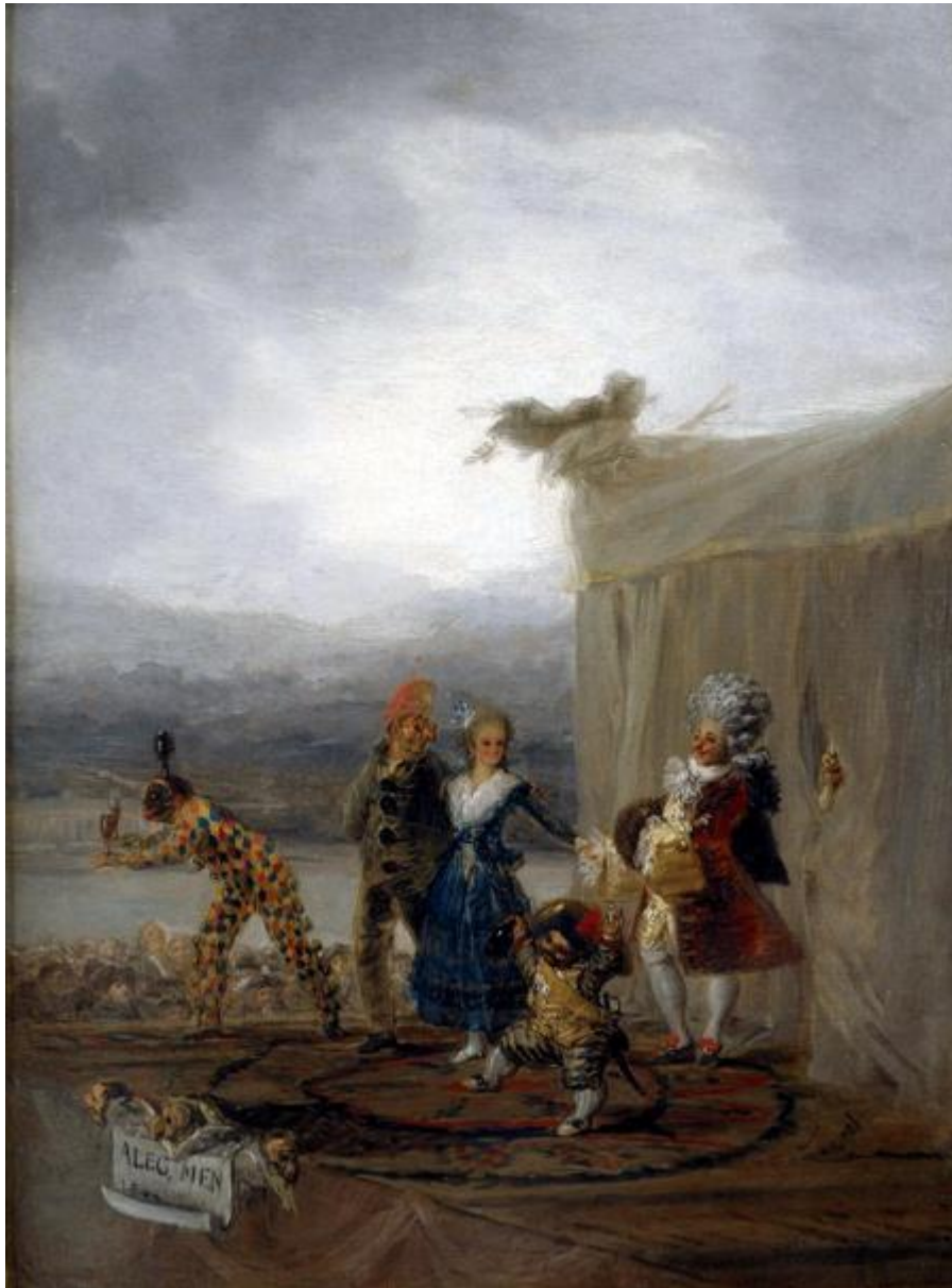
Ilustración 3. Los cómicos ambulantes, 1793, Madrid, Museo del Prado, GW 325.

vemos representada de esta manera— obedece sus propias pulsiones, y en otras circunstancias puede convertirse en «populacho», retomando un término de Goya.