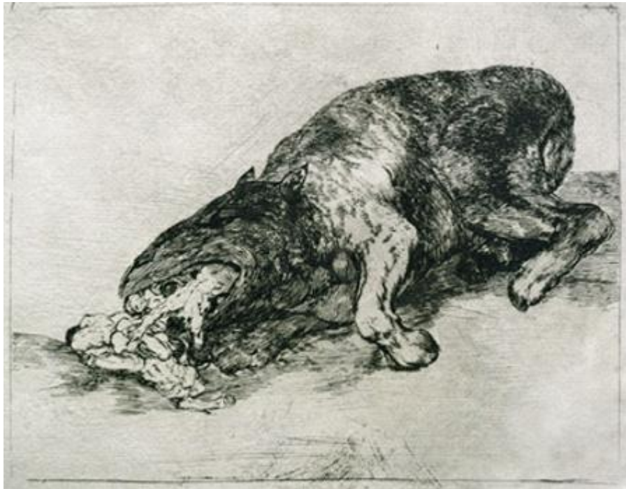
Figura 26. «Fiero monstruo», Desastre 81 .

corazón de algunos individuos, como el pintor y no es el único. Sin embargo, este mensaje positivo queda inmediatamente atemperado por otra imagen insertada en medio de la secuencia. Se trata de Desastre 81 (GW 1136, Figura 26), que representa a una especie de animal gigantesco atiborrándose de lo que parecen ser trozos de cadáveres.