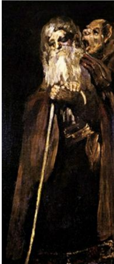
Ilustración 21. Dos viejos, 1820-1823, Madrid, Museo del Prado, GW 1627.

lugar vemos a dos personajes (GW 1627, Ilustración 21) muy diferentes entre sí.