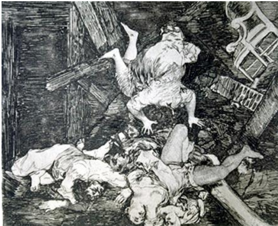
Figura 17. «Estragos de la guerra», Desastre 30 .

ingravidez. Entre el montón de cuerpos vemos un sillón y otros objetos. ¿Es efecto de un cañonazo que ha caído en la casa? La imagen del caos resultante nada tiene que envidiar al Guernica de Picasso y forma un símbolo inolvidable de la destrucción de la guerra. Se masacra no sólo a los seres humanos, sino también el espacio en el que han vivido, y en el que viven además el pintor y los espectadores de estas imágenes. La pérdida de referencias materiales es como la consecuencia de la desaparición de toda referencia moral. Las imágenes que Goya pintó y grabó forman una serie sin precedentes, tanto por los detalles que muestran como por la calidad del trazo.