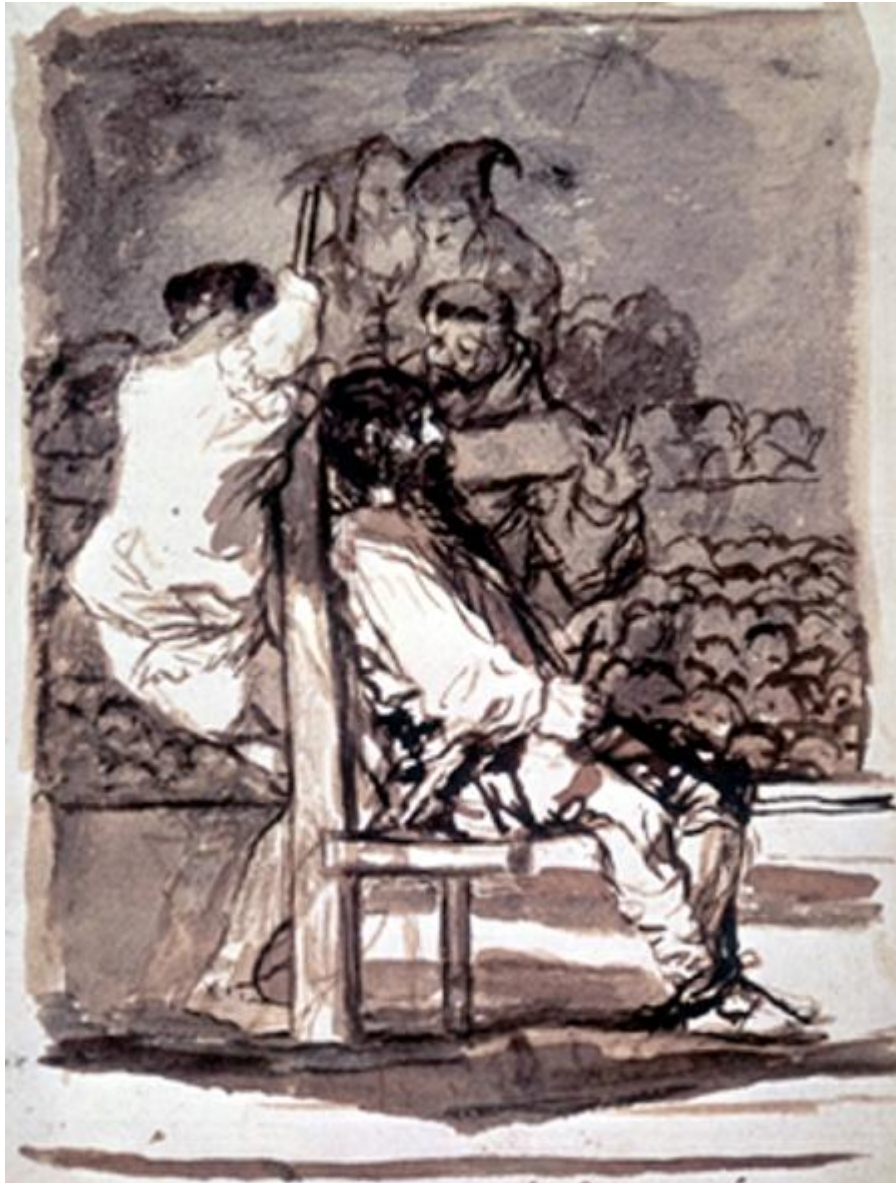
Figura 21. Muchos an acabado así.

En los últimos grabados de los Desastres el principal blanco son los poderes civil y religioso, que ahora sabemos que forman una sola entidad teológico-política. El carácter de las imágenes es diferente del que imperaba en la primera parte de la serie, y pasamos aquí de la compasión por las víctimas a la sátira de los opresores. Los actos de los que detentan el poder mantienen al pueblo —¿o al populacho?— en la ignorancia y la estupidez. Varios grabados tienen relación con la temática de los Caprichos , ya que