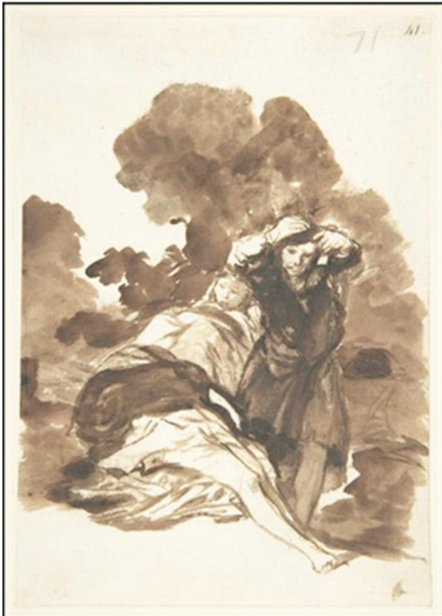
Figura 30. Despertar por los aires.

Más trágicas son las escenas que anuncian una violación, como E 41 (GW 1410), que muestra a un bandido arrastrando hacia una cueva a una mujer a la que se aferra su hijo. La leyenda dice: Dios nos libre de tan amargo lance (hemos visto ya este tema tratado en cuadros, Ilustraciones 12-14).