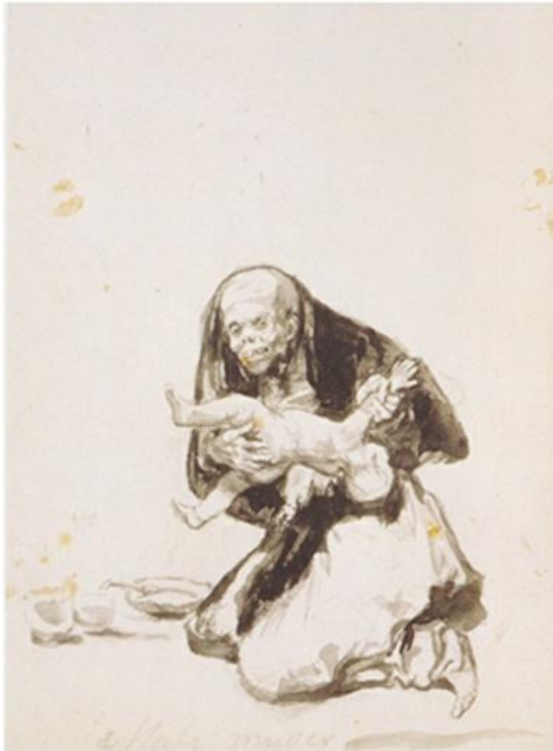
Figura 35. Mala mujer.

(F 18, GW 1446, Figura 34) muestra una escena de violencia conyugal: junto a una cama deshecha, el hombre sujeta a la mujer del pelo y la golpea, mientras ella intenta defenderse.