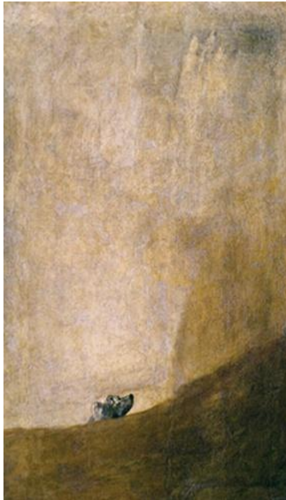
Ilustración 23. El perro, 1820-1823, Madrid, Museo del Prado, GW 1621.

ve ningún objeto a su alrededor, mantiene la idea de un espacio en el que está el animal. Goya nos hace salir del mundo que conocemos, pero sólo nos muestra el vacío.