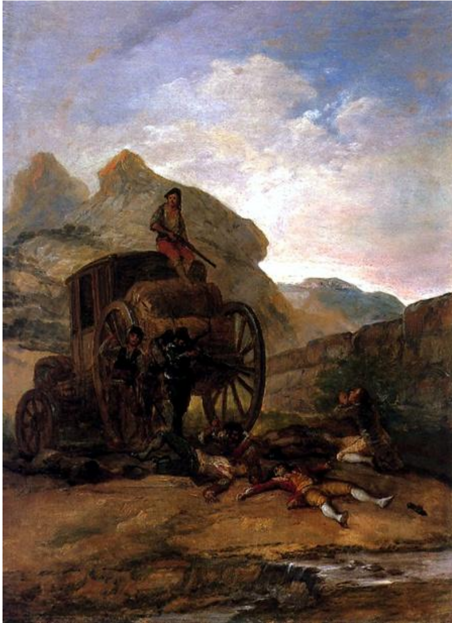
Ilustración 4. El asalto de la diligencia, 1793, colección particular (Madrid, Banco Inversión Agepassa), GW 327.

La escena que representan los actores es la de Polichinela, que se lleva a Colombina ante la mirada perpleja del ingenuo Pantalón.