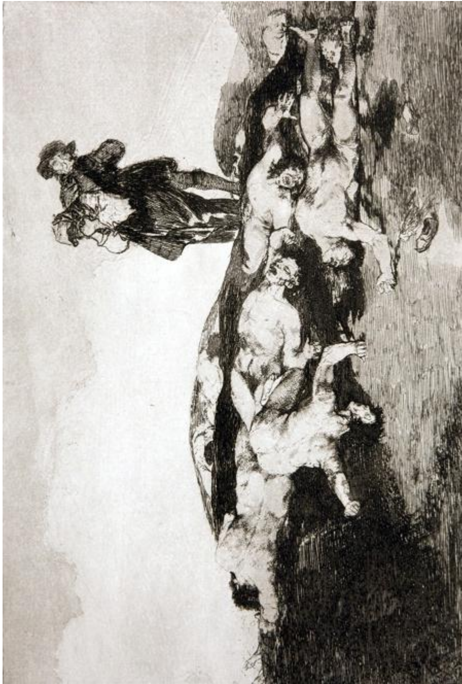
Figura 11. «Enterrar y callar», Desastre 18.