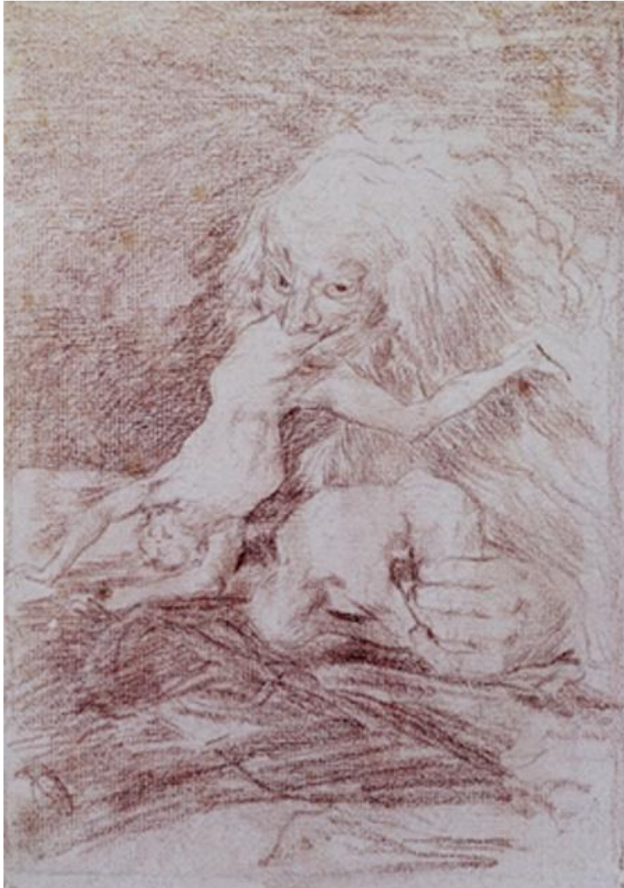
Figura 32. Saturno.

Cronos le había cortado el pene a su padre, Urano, y sufrirá la misma suerte a manos de Zeus, su hijo.