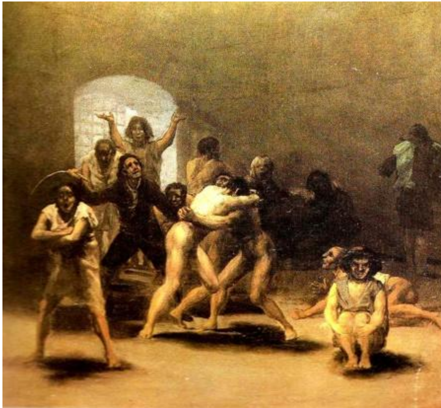
Ilustración 6. El corral de locos, 1793, Dallas, Texas, Meadows Museum, GW 330.

Es la primera imagen de locura de Goya, que en lo sucesivo retomará a menudo el tema de la razón y la sinrazón, hasta el punto de que durante muchos años se extenderá la leyenda de que el propio pintor se volvió loco.