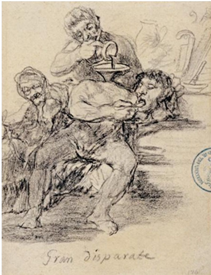
Figura 38. Gran disparate .

Otro propone una solución irónica a los problemas de pareja. Representa a un ser con dos cabezas, una masculina y otra femenina, que sonríen amablemente.