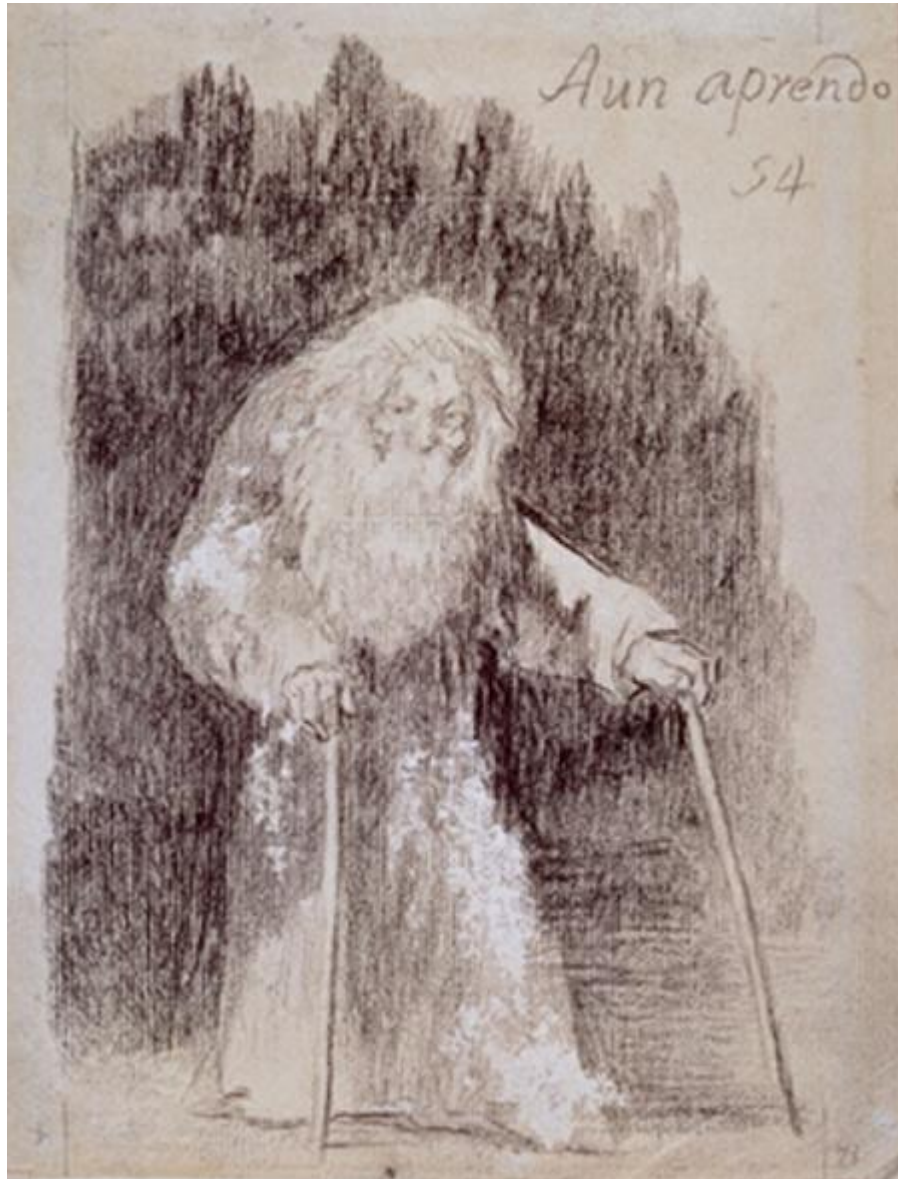
Figura 31. Aun aprendo.

Esta interpretación podría confirmarse en un dibujo probablemente posterior (G 54, GW 1758, Figura 31), que representa a un anciano bastante parecido, que en este caso se apoya en dos bastones.