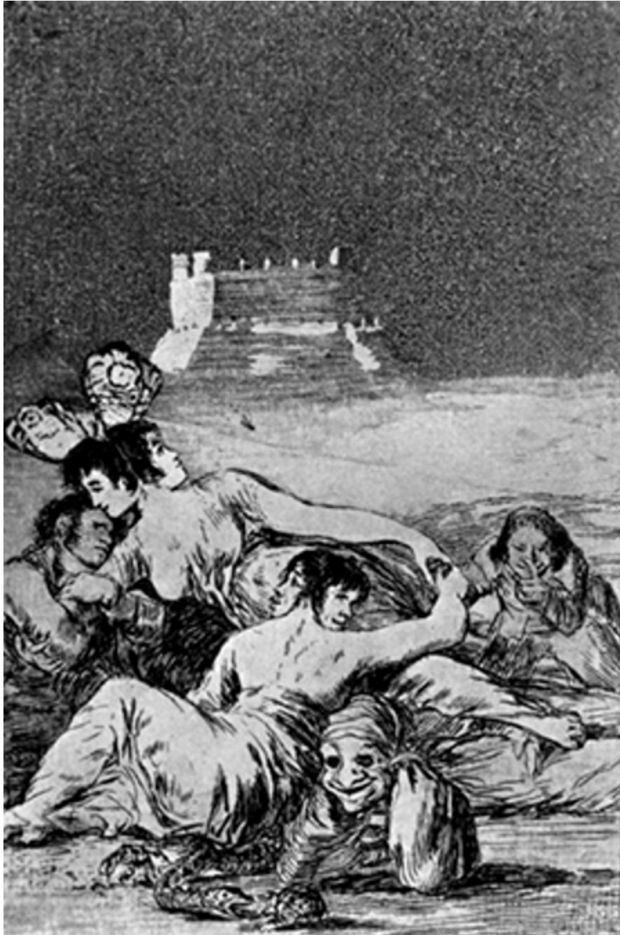
Figura 2. Sueño. De la mentira y la inconstancia.

encarnada por un animal. Una mujer del tipo de la duquesa se sitúa ante el espejo, pero la imagen que ve es la de una serpiente.