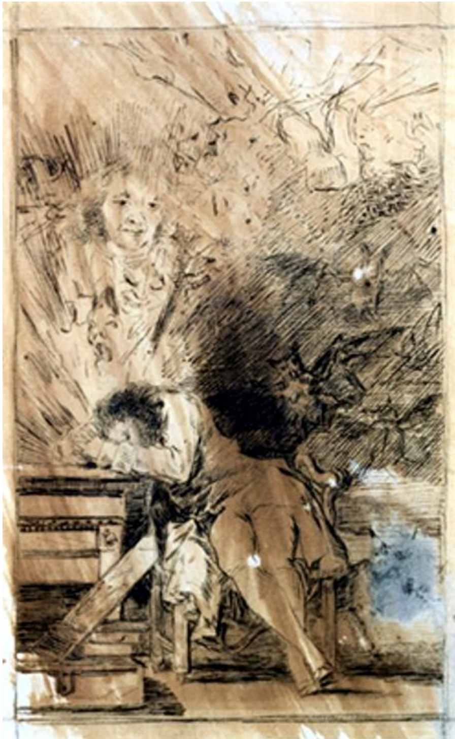
Figura 6. El sueño de la razón.