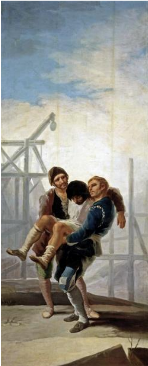
Ilustración 1. El albañil herido, 1786, Madrid, Museo del Prado, GW 266.

imágenes evocan la vida de personas sencillas al margen de todo entorno idílico o alegórico, como Los pobres en la fuente (GW 267). Un cartón como