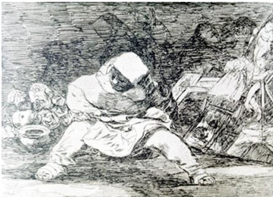
Figura 23. «Que locura!», Desastre 68 .

Estos dibujos y grabados que representan diferentes formas de violencia llaman la atención no sólo por la temática, sino también porque en ellos Goya alcanza nuevas cimas. La economía y la potencia de su trazo son impresionantes. En los Caprichos y los dibujos preparatorios Goya se detenía en detalles, pero en la época de los Desastres las escenas se simplifican y los personajes se ven cada vez desde más cerca. Sus rasgos expresan un solo estado, una actitud, un sentimiento, pero con mucha más fuerza. Los principios de la representación han evolucionado. En el pasado, pintores y espectadores compartían la misma concepción del espacio, que les permitía comunicarse con éxito, y a la vez las fronteras entre observación e invención, entre real e imaginario, estaban claras. En los grabados de los Desastres y en los dibujos de esa misma época Goya deja de preocuparse por este tipo de cuestiones.