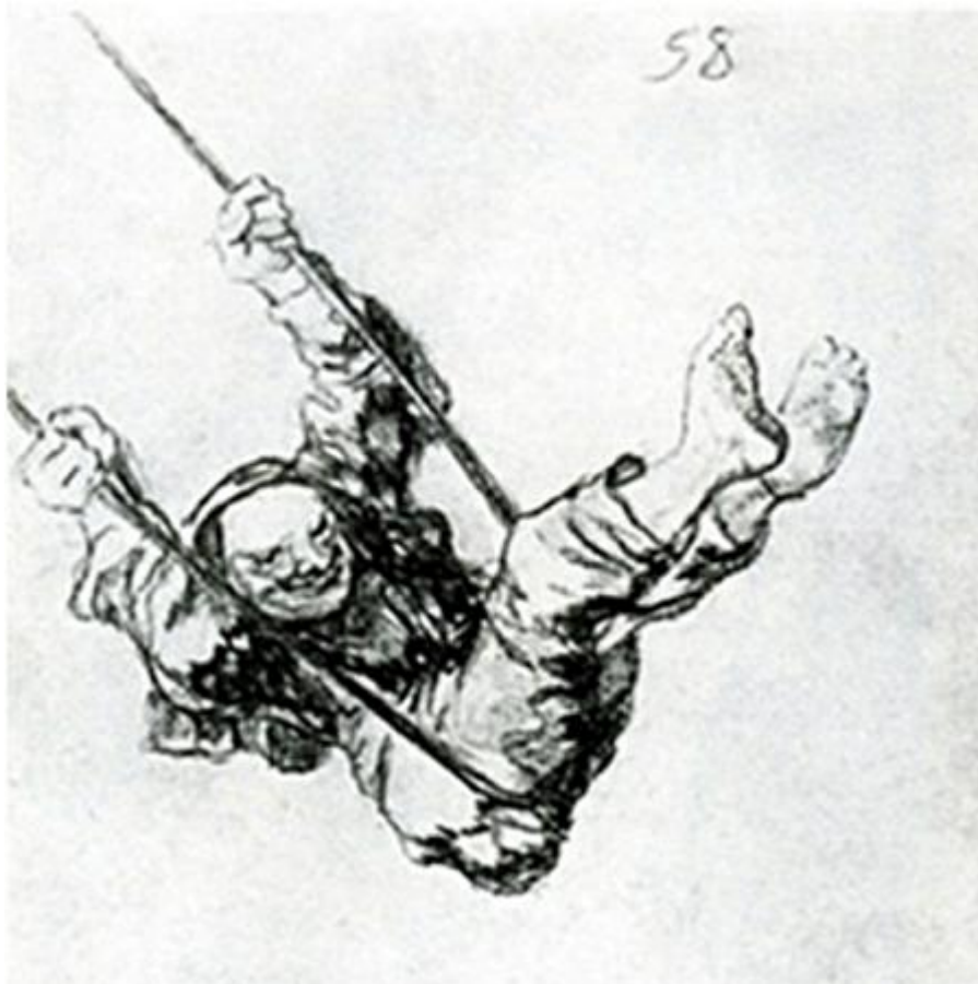
Figura 42. Viejo en un columpio.

Entre los últimos dibujos de Goya hay varios que muestran a personajes ancianos, pero activos y felices. Ya no se burla de ellos, como en algunos dibujos de décadas anteriores. La edad lo ha hecho más tolerante con la torpeza de los viejos. Así, un lego patinando (H 28, GW 1790), un fraile flotando por los aires (H 32, GW 1794) y dos viejas comadres bailando (H 35, GW 1797). Encontramos además un fantasma bailando con castañuelas (H 61, GW 1818, Figura 41), que parece haberse convertido en un compañero bienintencionado, en absoluto atemorizador.