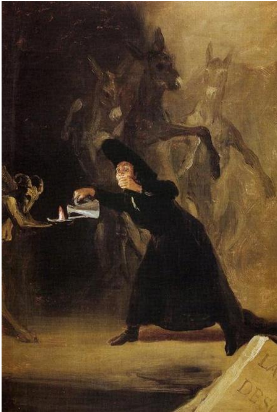
Ilustración 8. La lámpara descomunal, 1797-1798, Londres, National Gallery, GW 663.

Dos testigos presencian la escena espantados, aunque intentan no verla: uno se tapa los ojos, y el otro se cubre la cabeza con una tela. Estos atléticos demonios parecen perfectamente reales y nada tienen de fantasmagóricos.