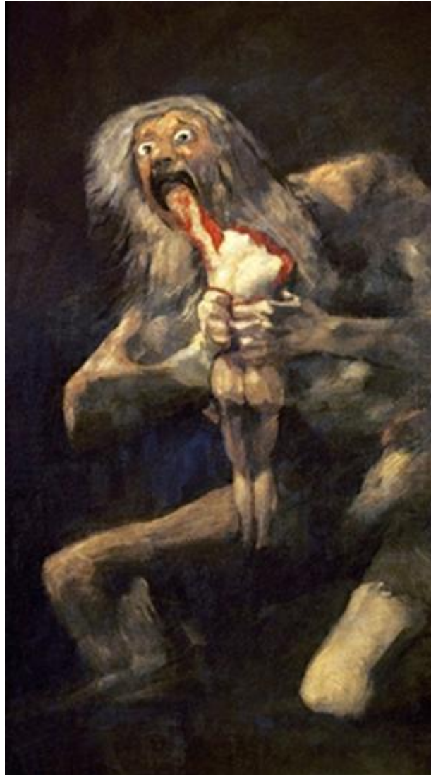
Ilustración 22. Saturno, 1820-1823, Madrid, Museo del Prado, GW 1624

Así, las dos imágenes representan el asesinato de una persona del sexo opuesto. Ofrecen una interpretación extrema de las relaciones entre los dos sexos, pero una interpretación que tiene numerosos antecedentes en la obra del pintor durante los años que separan las Pinturas negras de los Caprichos . Goya raramente ha representado versiones idílicas, incluso simplemente apacibles, de las relaciones entre hombres y mujeres. Desde antes de su enfermedad ofrece una visión satírica de la pareja en el cuadro de 1792 titulado La boda (GW 302), cartón para la serie de tapices «rústicos y