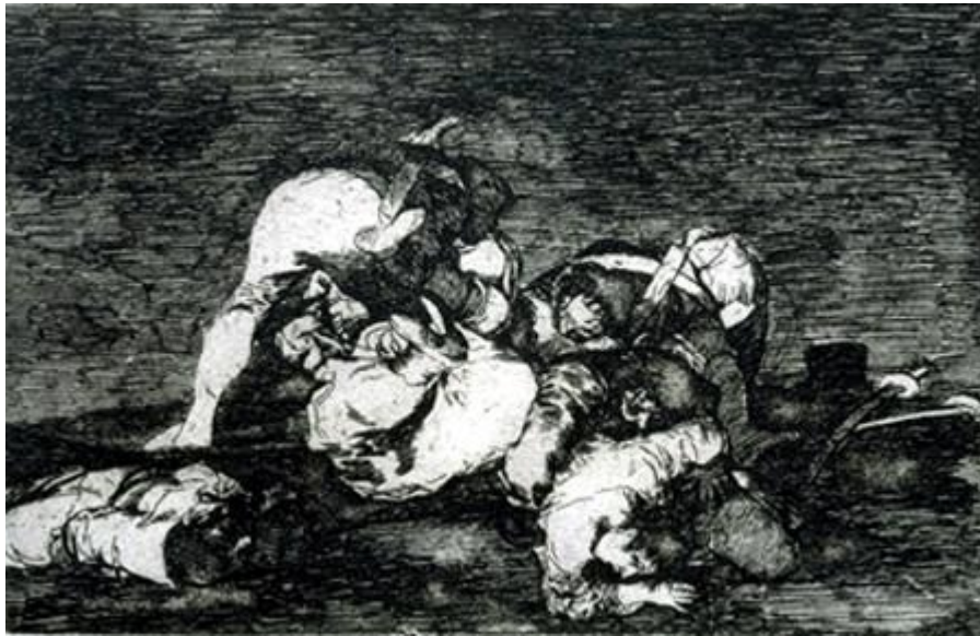
Figura 14. «Tampoco», Desastre 10 .

consuelo— que esta forma de violencia no es un invento reciente, y que tampoco está reservada a los pueblos exóticos. La guerra trae consigo asesinatos, atrocidades y hambre.