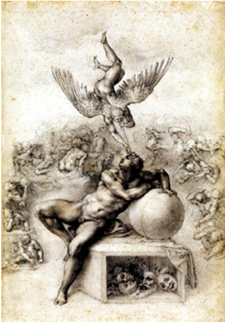
Figura 7. Miguel Ángel. El sueño.

Comparemos estos dibujos (y este grabado) de Goya con un famoso dibujo de Miguel Ángel, al que suele aludirse con el mismo término, El sueño (Figura 7), de hacia 1533.