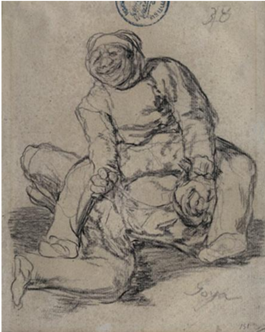
Figura 39. Victoria fácil.

mismo rostro e incluso la misma sonrisa satisfecha. ¿La violencia humana tendrá siempre lugar entre enemigos complementarios, entre hermanos intercambiables?