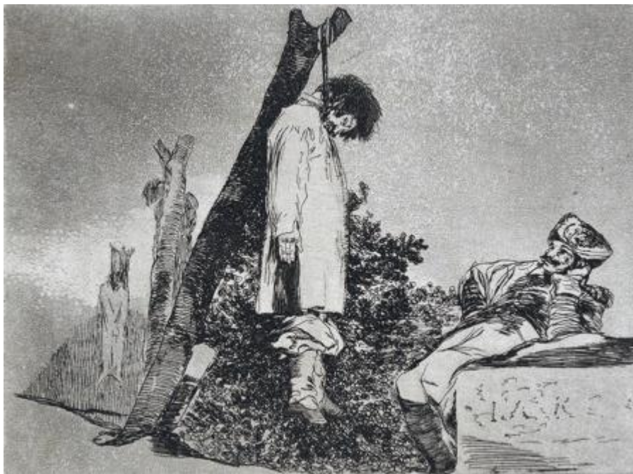
Figura 16. «Tampoco», Desastre 36.

Uno de los elementos más abrumadores de estas imágenes reside no en la violencia de los actos, sino en la indiferencia, incluso en la tranquilidad con la que se comportan sus protagonistas. Desastre 36 (Figura 16) es ejemplar en este sentido.