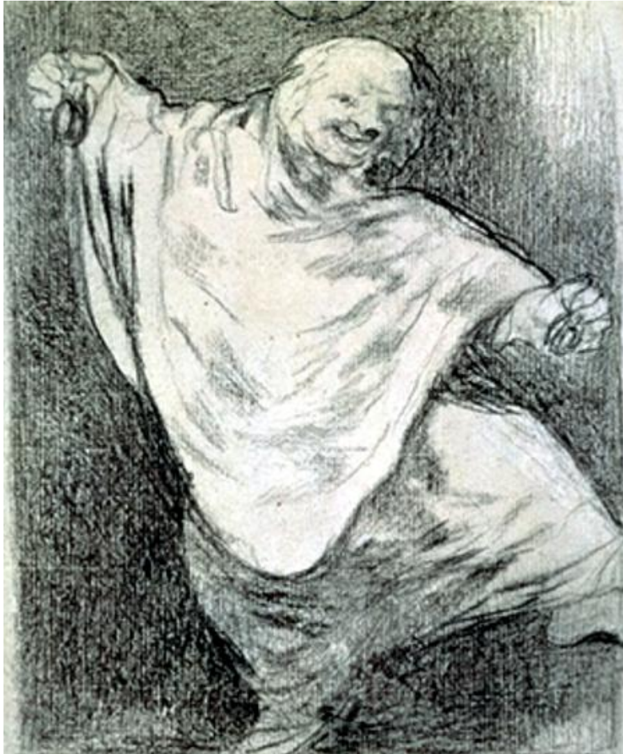
Figura 41. Fantasma bailando con castañuelas.

niño de 4 años que es el que se mira en Madrid de hermoso, y lo he tenido malo, que no he vivido en todo este tiempo», escribía a Zapater (23 de mayo de 1789). Deja a Mariano su casa con las Pinturas negras y hace varios retratos enternecedores de él. A los veintidós años, en 1828, va a Burdeos a ver a su abuelo, que se emociona tanto que se debilita.