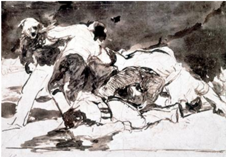
Figura 18. Será lo mismo.

combate en el que los muertos y los vivos se parecen, en el que es imposible saber a qué bando pertenece cada contendiente. Sus gestos hablan, pero sus rostros están mudos. El cielo es negro y la tierra blanca. O también en GW 1148, otro sepia negro, en el que el combate está más avanzado. Un contendiente está en el suelo, y su angustia se concentra en el gesto de su mano izquierda y en la expresión de su rostro. Otro se dispone a masacrarlo, aun que quizá sucumba antes a consecuencia de los golpes de un tercer agresor. Una vez más los medios utilizados logran de forma admirable el objetivo del pintor, la impresión de rapidez de la pincelada imita la precipitación de los combates. Tanto la mezcla de formas como el juego de blanco y negro permiten fijar para siempre el caos y la violencia de la guerra.