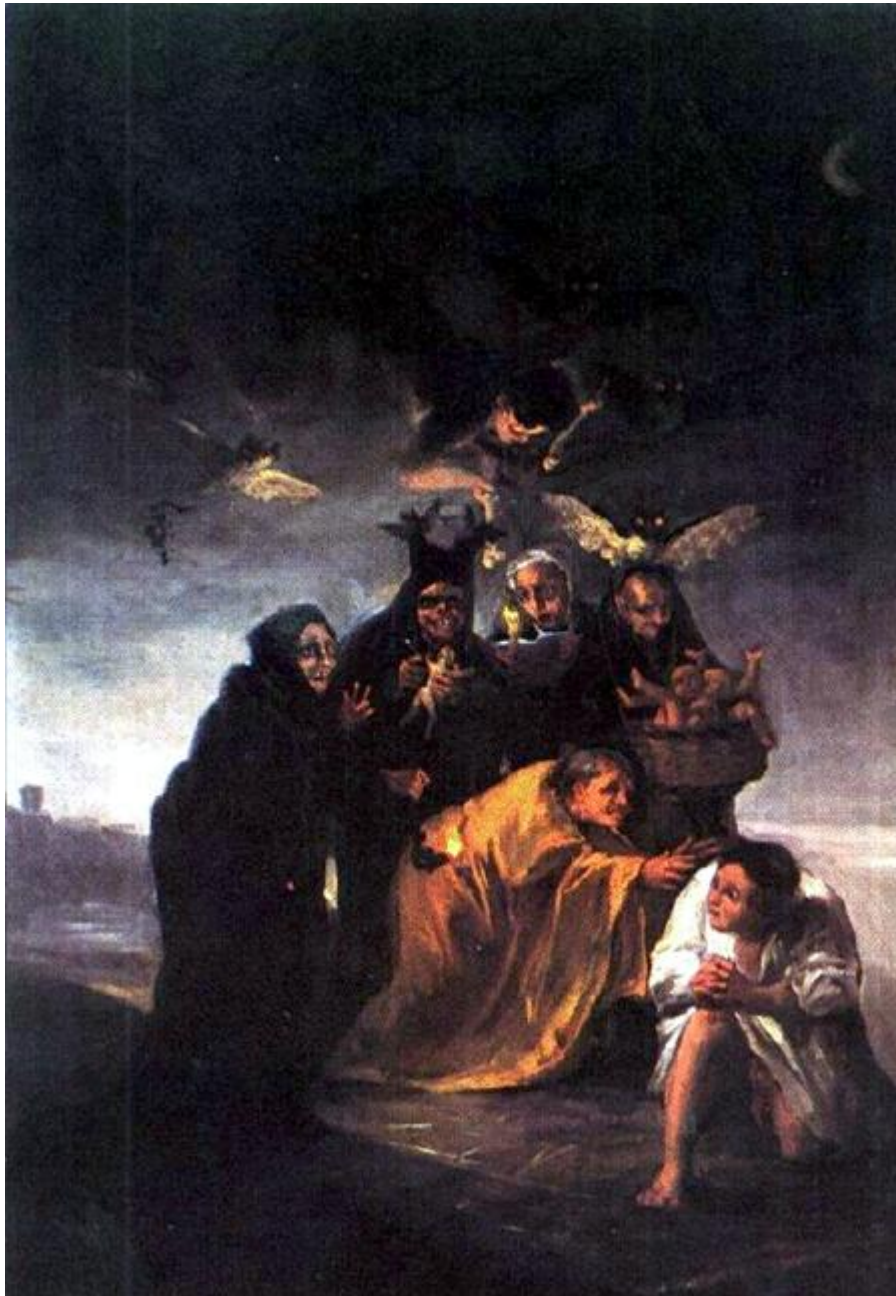
Ilustración 9 El conjuro, 1797-1798, Madrid, Museo Lázaro Galdiano, GW 661.

encontramos en la decoración de las iglesias imágenes cuyo origen no se encuentra ni en los textos sagrados ni en la observación del mundo que nos rodea, sino que proceden de la imaginación de los escultores y los pintores.