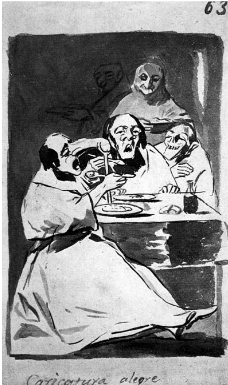
Figura 3. Caricatura alegre.

manera de representar el mundo visible. En la primavera de 1797 la ruptura afectiva hace que se vuelque básicamente en su universo interior; que en adelante intentará expresar.