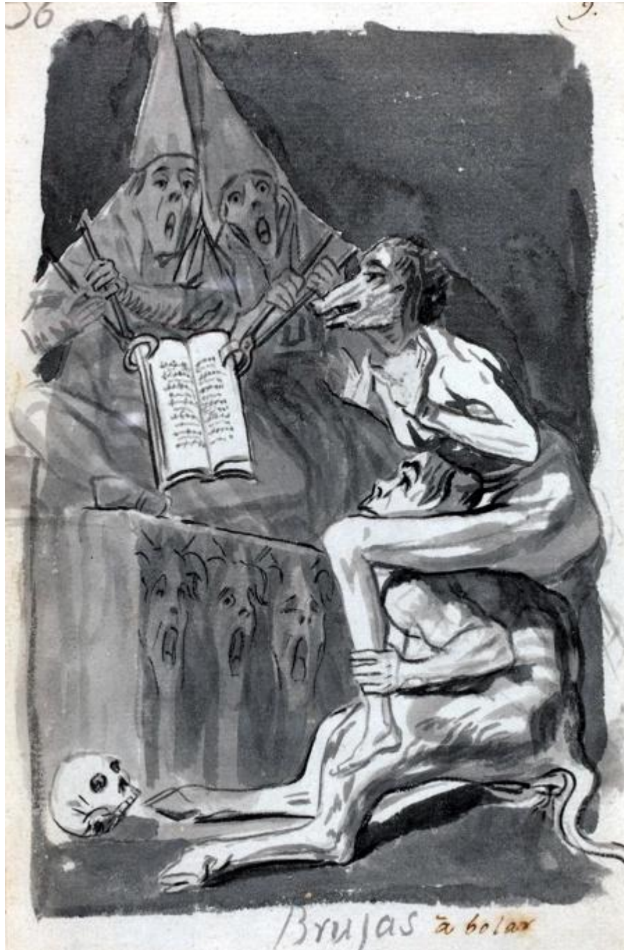
Figura 4. Brujas a volar.

Goya retomará posteriormente este dibujo en el Capricho 70 (GW 591), titulado «Devota profesión».