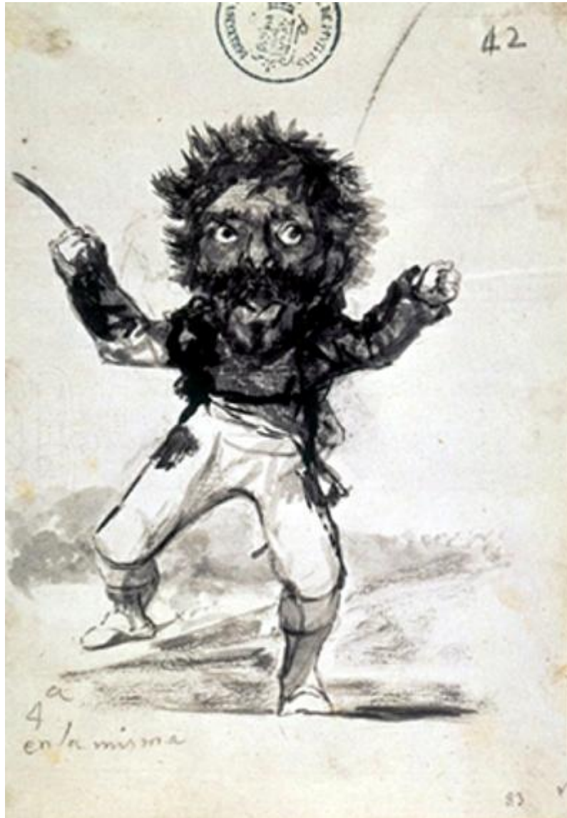
Figura 10. Visión burlesca. 4ª en la misma.

muestra volando, intentando alzar una pesada tapadera. La leyenda anuncia: Nada dicen , como más tarde en el Desastre 69 .