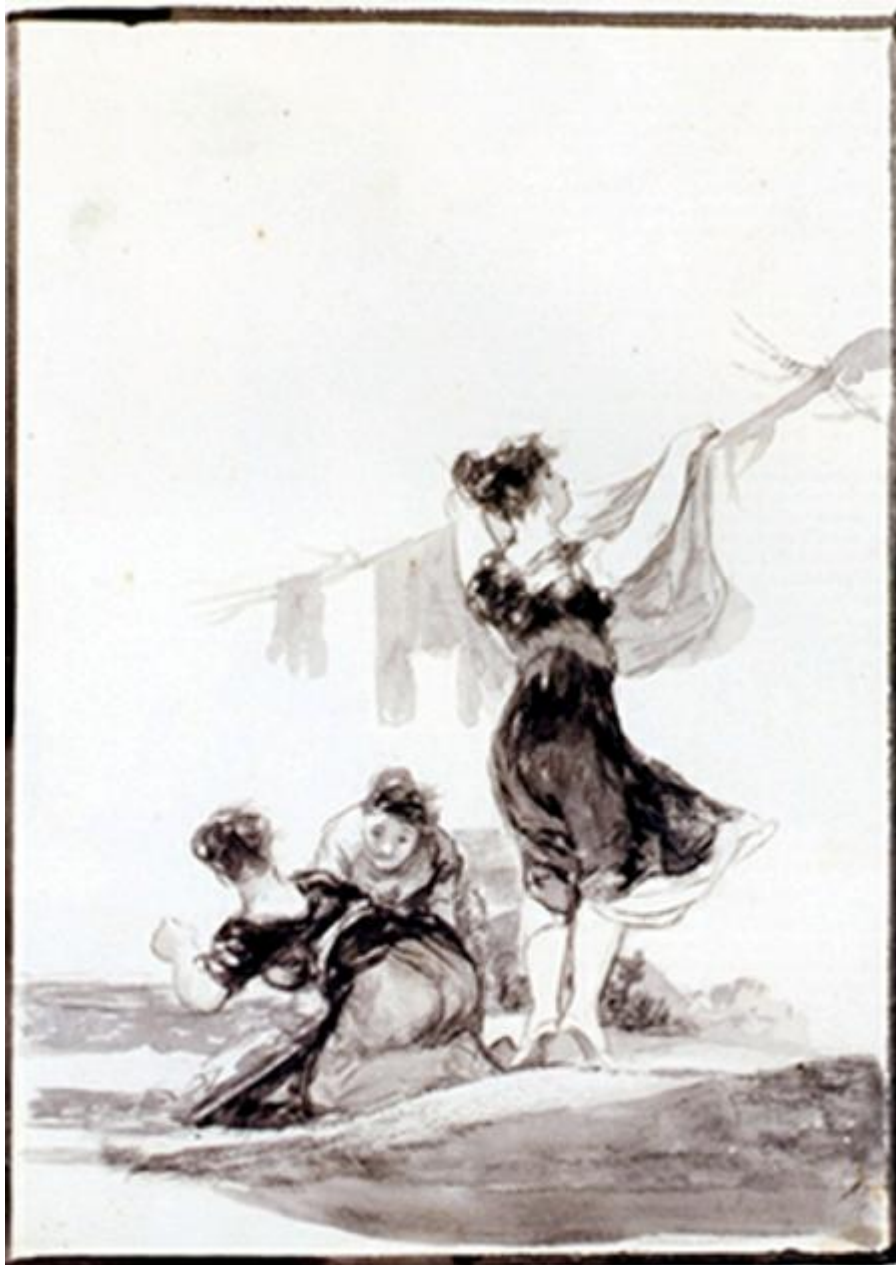
Figura 27. Hutiles trabajos.

un paisaje, sumida en pensamientos que no deben de ser alegres: Déjalo todo a la providencia , le recomienda (E 40, GW 1409). La campesina de E 28 (Figura 1) forma parte de esta misma serie.