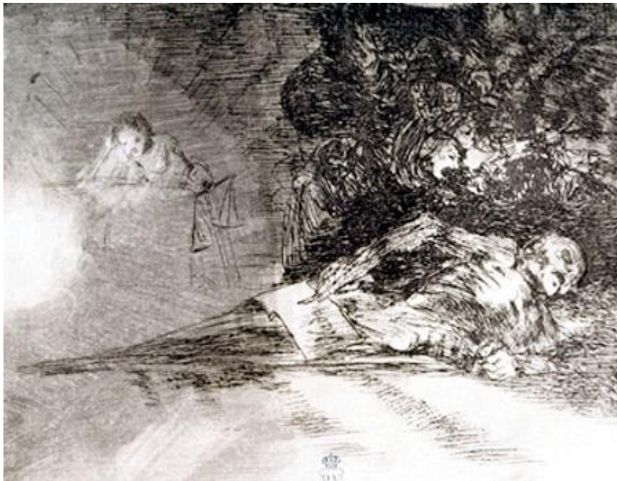
Figura 22. «Nada ello dirá», Desastre 69 .

Entre estas imágenes está también la que en un principio Goya pensaba colocar al final de la serie, que muestra los efectos de la guerra y del hambre: Desastre 69 (GW 1112, Figura 22). Su presencia actual entre los grabados sobre las fechorías de la paz hace que su alcance sea todavía más amplio. El grabado representa a un muerto acompañado de máscaras fantasmagóricas que gesticulan y de una balanza de la justicia. El muerto sujeta en la mano izquierda una corona de paja, y con la izquierda — pese al avanzado estado de descomposición— ha conseguido escribir en una tablilla la palabra nada , que Goya confirma en la leyenda: «Nada. Ello dirá».