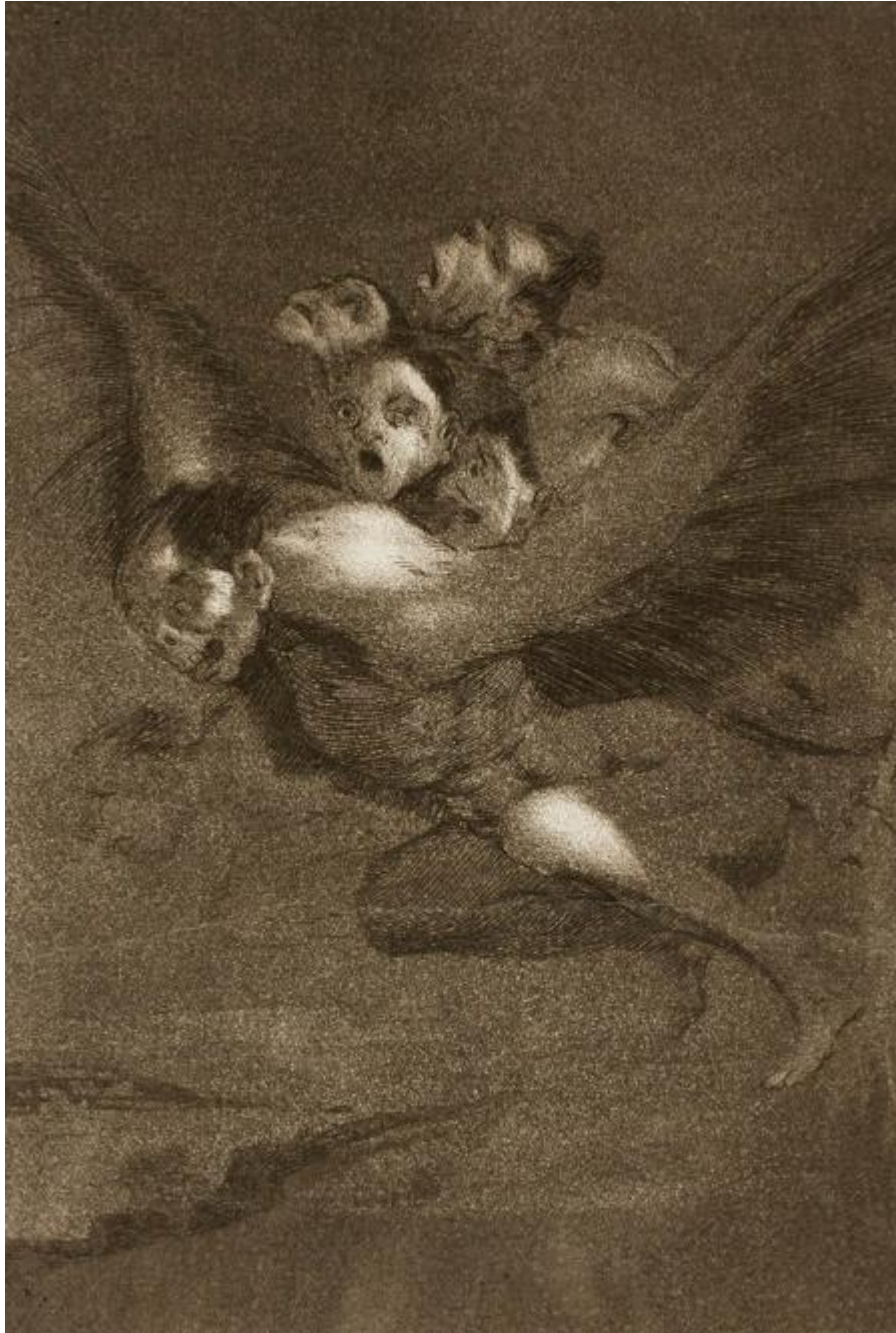
Figura 9. «Buen viaje», Capricho 64.

las ve». Estos habitantes de la oscuridad no pueden ser expulsados de la mente, en donde habitan de forma permanente.